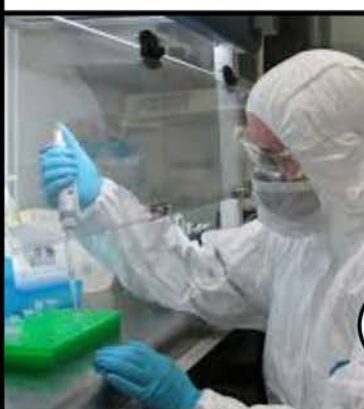
ONDERZOEKERS ANALYSEREN DE DATA VANUIT DIVERSE INVALS- HOEKEN, O.A. GENETICA (HET DNA), BIO-INFORMATICA EN NEUROPSYCHOLOGIE.