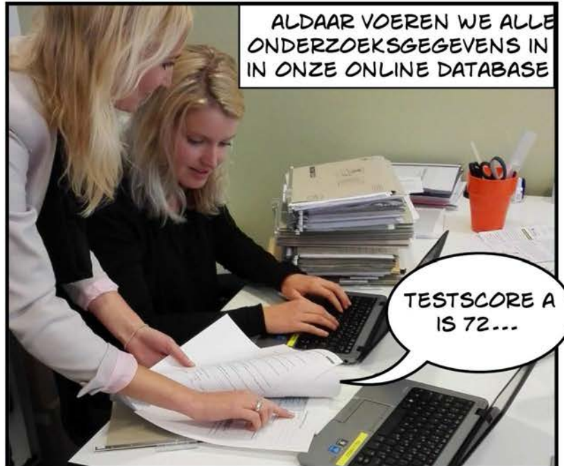
TESTSCORE A IS 72...