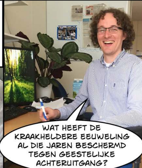
WAT HEEFT DE KRAAKHELDERE EEUWELING AL DIE JAREN BESCHERMD TEGEN GEESTELIJKE ACHTERUITGANG?