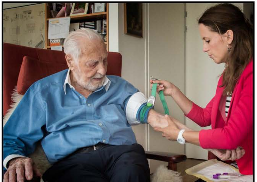
...EN NEMEN WE EEN PAAR BUISJES BLOED AF VOOR DE DNA-ANALYSES.